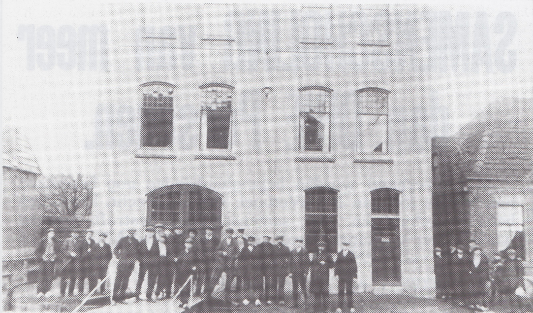
1930. Het personeel van Modderkolk & Dijs voor de fabriek aan de Kerkweg. De fabriek stond waar nu de Heuvelhof is.

De politie had tot taak de orde te bewa-