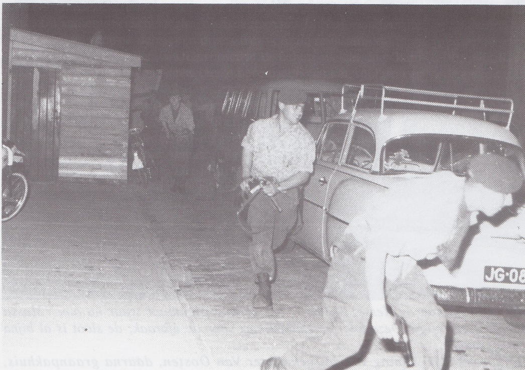
Commando's rukken op vanaf de Gouweoever, langs het sluisje, naar Het Centrum, Commandopost van 'de vijand'.

In de nacht van woensdag op donderdag vinden er straatgevechten plaats en wordt Het Centrum met veel lawaai onder vuur genomen. Er wordt geschoten met losse flodders, lichtkogels en plastic bommen. Het luxe jacht 'Vrijheid Blijheid' van Citosa-directeur Kok vaart de Gouwe af. In de kombuis houden zich zo'n 30 commando's schuil. Dit Turfschip van Breda anno 1962 meert af aan de achterkant van Het Centrum, bij het Sluisje. Een regen van lichtkogels verlicht het strijdperk. Schietend maken de commando's een omtrekkende beweging en nemen de voorkant onder vuur met mitrailleurs en vlammenwerpers. Tegelijkertijd wordt het politiebureau aan de Kerkweg aangevallen. Buurtbewoners, die de commando's helpen, worden 'in arrest' genomen. De overwinning van de commando's is compleet; het grootste deel van de politiemacht is 'uitgeschakeld'.